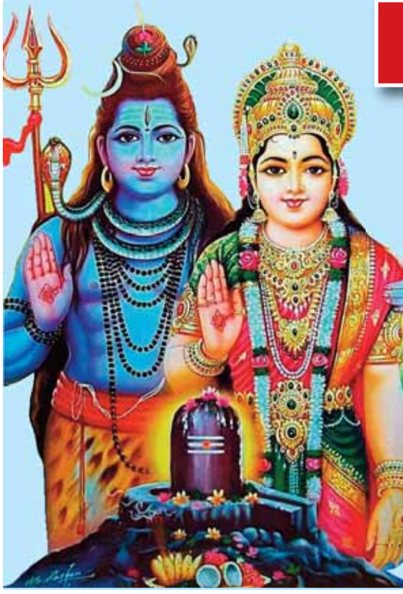
हरिभूमि न्यूज अनूपपुर।

14 जुलाई श्रावण मास के प्रथम सोमवार को भक्तिभाव और श्रद्धा का अद्भुत संगम नर्मदा मंदिर अमरकंटक तथा ज्वालेश्वर महादेव मंदिर में देखने को मिला। तड़के से ही श्रद्धालुओं की लंबी कतारों मंदिरों के बाहर लगनी शुरू हो गई थीं। हर-हर महादेव और नर्मदे हर के जयघोष से पूरा वातावरण गुंज उठा, वही पूरे जिले के शिव मंदिरों में हर हर महादेव के जयकारों से वातावरण गुंजायमान होता रहा। जिला मुख्यालय समेत कोयलांचल व मैकलांचल में शिव भक्ति में लीन दिखे शिव भक्त और पूरा दिन पूजन अर्चन का दौर चलता रहा।